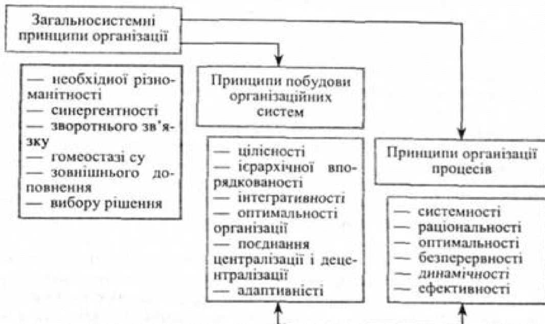
Рис. 1 – Основні принципи організації торгівлі [2]

Принцип емерджентності полягає в тому, що властивості цілісної системи дедалі більше відрізняються від властивостей складових у мірі збільшення розриву між розмірами цілого і складових. Цей принцип вказує на необхідність всебічного узгодження не тільки структури елементів системи, але і їх цілей і порядку взаємодії.