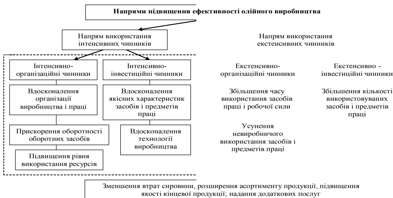
Рис. 2 – Напрями підвищення ефективності олійного виробництва

Однак, не дивлячись на широке коло перспектив підприємств олійно-жирової галузі України, для збереження конкурентних переваг продукції, необхідною умовою є розробка та впровадження інноваційних напрямків, які підвищують конкурентоспроможність даної галузі, виведуть її на більш високий рівень.