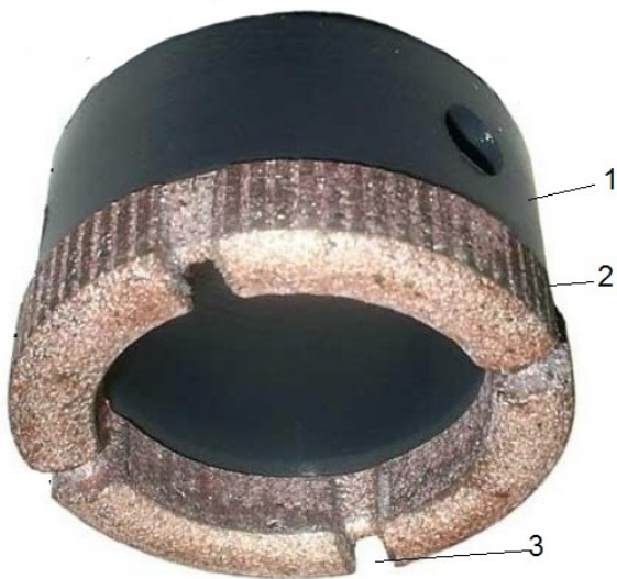
Рис. 1 – Загальний вигляд коронки: 1 – корпус; 2 – матриця; 3 – промивальні канали