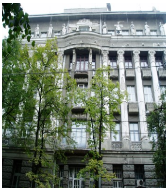
Рис. 1. Колишнє приміщення Центральної наукової сільськогосподарської бібліотеки (м. Харків, вул. К. Лібкнехта, 82)

Згідно з протоколом №11/664 від 3 квітня 1930 р. Ради Народних Комісарів УСРР «Про реконструкцію сільськогосподарської дослідної справи» було створено мережу республіканських науково-дослідних інститутів та установ, до складу якої ввійшла й Центральна наукова сільськогосподарська бібліотека. Хоча остаточно Бібліотека відбулася як спеціальна наукова установа відповідно до Постанови Ради Народних Комісарів УСРР (РНК УСРР) №154 від 22 травня 1931 року «Про організацію Всеукраїнської академії сільськогосподарських наук» [1, с. 17].