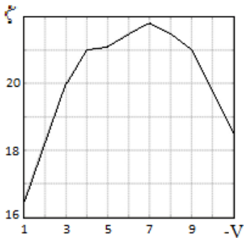
Рис. 2 – Зависимость коэффициента обратного сопротивления диода от скорости воды.

определенной точке ударного трубопровода. Для моделирования динамических процессов в трубопроводах, которые сопровождаются гидравлическими ударами, как правило, используются уравнения, представленные, например, в [5], решение которых определяется на прямоугольной сетке характеристик. Набор соответствующих модулей в среде пакета MatLab рассмотрен в работе [6]. Для их использования при решении поставленной в настоящей работе задачи необходимо рассмотреть описание состояния потока жидкости в точке установки крупномасштабного струйного диода.