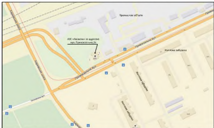
Рис. 1 – Карта-схема розміщення автозаправної станції за адресою вул. Привокзальна,1-А

Згідно класифікації АЗС (змiна №10 ДБН 360-92) [13], по вул. Привокзальна, 1, а (рис.1) відноситься до II категорії (середньої) за потужністю, місткістю резервуарного парку та технологічними рішеннями. Найближча житлова забудова знаходиться в південно-східному напрямку на відстані 110 м.