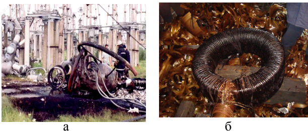
Рис. 3 – Виведені з експлуатації трансформатори струму 750 кВ

Трансформатор струму ТФРМ-750 (виготовлений у 1982 р., масло Т-750) був виведений з експлуатації в 2007 р. на підстанції «Вінницька 750» (рис.3 б).