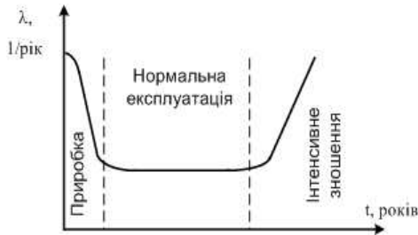
Рис. 1 – Залежність пошкоджуваності обладнання (одиниць за рік) від року експлуатації

Відома залежність пошкоджуваності обладнання в залежності від терміну експлуатації (рис. 1).