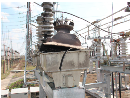
Рис. 2 – Пошкоджені в 2015 році трансформатор напруги 35 кВ (2014 року випуску)

Ця тенденція спостерігається і у високовольтних вимірювальних трансформаторів. На рис. 2 та 3 показані пошкоджені трансформатор напруги 35 кВ у 2015 році (перший рік експлуатації), трансформатор струму 750 кВ (понад 20 років експлуатації), та виведені з експлуатації трансформатори струму 750 кВ (а – 25 років експлуатації).