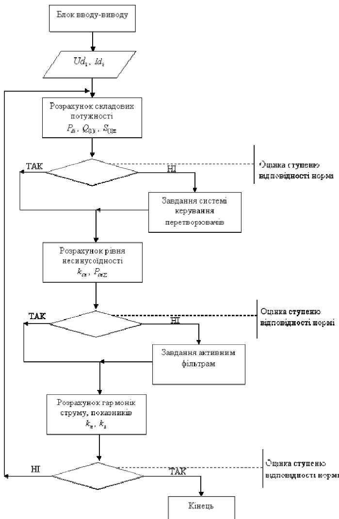
Рис. 2. Алгоритм роботи системи автоматизованого обліку та керування енергетичними показниками

Розроблена система автоматизованого активного контролю показників якості електричної енергії забезпечує оцінку показників якості електричної енергії у вузлах електроенергетичної системи та здійснює відповідні заходи щодо формування енергетичного балансу системи живлення з метою оптимізації її енергетичних показників.