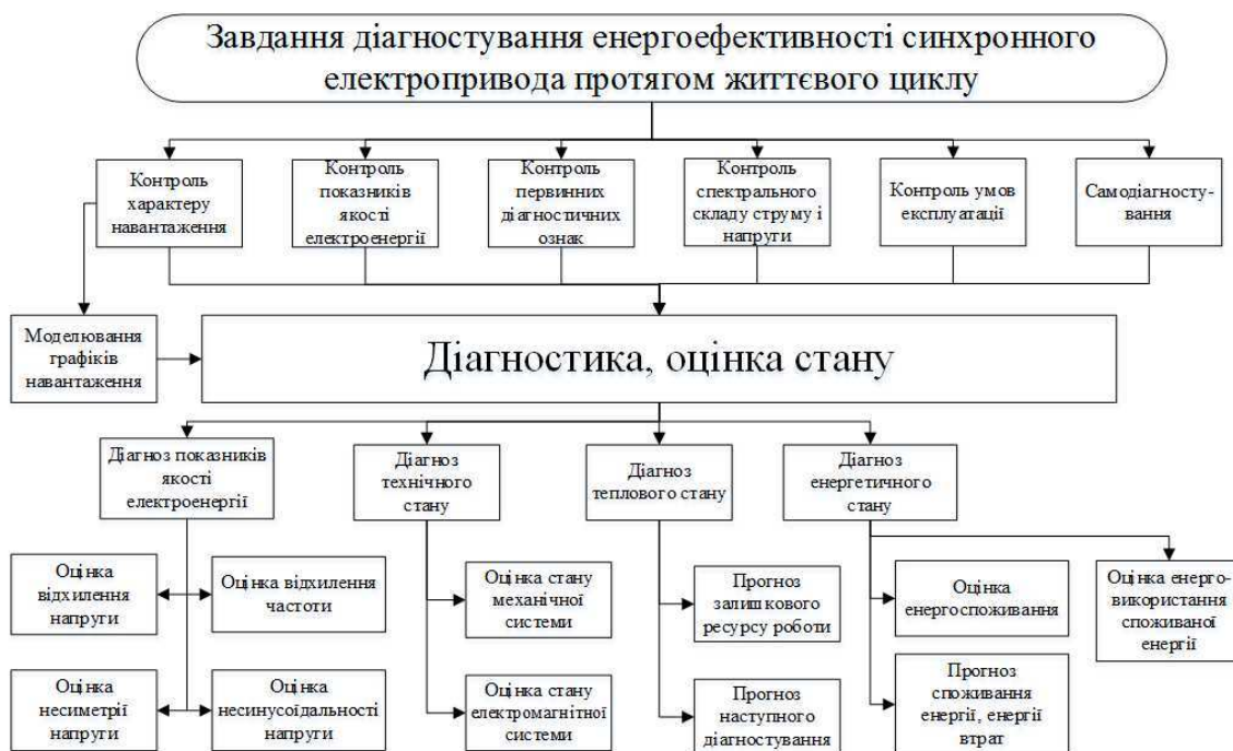
Рис.1 Завдання діагностування енергоефективності синхронного електропривода

Матеріали і результати досліджень. Послідовність діагностування синхронного електропривода така (рис. 1): вимірювання діагностичних параметрів; визначення первинних діагностичних ознак; струмовий захист; визначення показників якості електроенергії (ПЯЕ); спектрально-струмовий аналіз; визначення параметрів процесу енергоспоживання і робочих параметрів; діагностування технічного стану; визначення параметрів процесу енерговикористання; діагностика енергетичного стану; визначення параметрів теплової моделі й захисту, залишкового ресурсу, енергії, що споживається, її втрат; встановлення наступного строку діагностування.