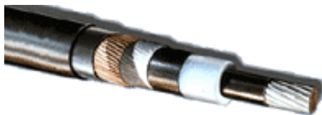
Рис. 3. Кабель з ізоляцією з шитого поліетилену

високої пропускнув здатністю; низьким вагою, меншим діаметром і радіусом вигибу; більш високою надійністю; можливістю прокладку на складних трасах; відносно низькою себестоімістю прокладку. Використання кабелів з ізоляцією з шитого поліетилену замість інших кабелів з полімерної ізоляцією дозволяє збільшити тривалу допустимую температуру нагріву жил кабелів при робочому струмі до 90°C і до 250°C при токах короткого замикання (рис. 3).