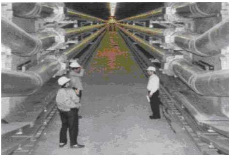
Рис. 4. Элегазовый токопровод на напряжение 550 кВ (Westboro, США)

ГИЛ, как правило, прокладываются в тоннелях. В настоящее время в мире реализовано более 500 проектов ГИЛ (рис 4.) [4]