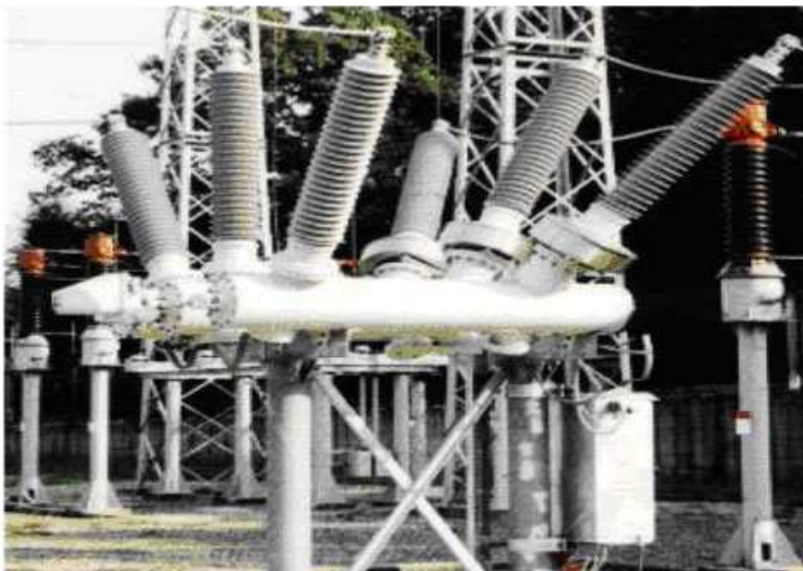
Рис. 5. Устройства PASS (Plug And Switch System)

С целью дальнейшего увеличения компактности ОРУ наблюдается тенденция к объединению в одном герметизированном отсеке разных аппаратов, например, выключателя с трансформаторами тока, с разъединителями и заземлителями, так называемых комбинированных выключателей типа PASS (Plug And Switch System – система "присоединяй и включай") (рис. 5) [5].