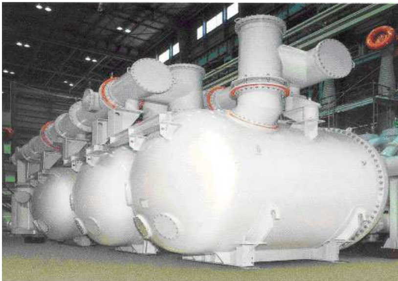
Рис. 6. Полностью герметизированная элегазовая подстанция 275 кВ (Тошиба, Япония)

В результате, в Японии, Австралии и других странах в мегаполисах уже реализован ряд проектов полностью герметизированных и автоматизированных компактных подстанций без обслуживания – 66-362 кВ с элегазовой изоляцией (рис. 6).