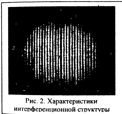
Рис. 2. Характеристики интерференционной структуры

Введем систему координат, связанную с «центром тяжести» измерительного объема (рис.2.). Если предположить, что ось X направлена в сторону движения среды, то размеры \Delta x и \Delta y будут определять величину центрального сечения ИО. Вдоль оси Z, перпендикулярной плоскости рисунка, размер интерференционной структуры \Delta z