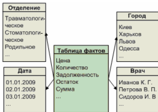
Рис. 3. Упрощенный пример «схемы звезда»

лекарства и медицинские принадлежности, даты поступления и выписки и т.д. При пересечении этих измерений в различных комбинациях можно без особого труда проанализировать следующее: какие лекарства больше всего используются, на какие моменты приходится пик посещаемости каких из отделений, какова текущая задолженность клиентов перед поликлиникой, по какой из страховых компаний максимальная задолженность и т. д.