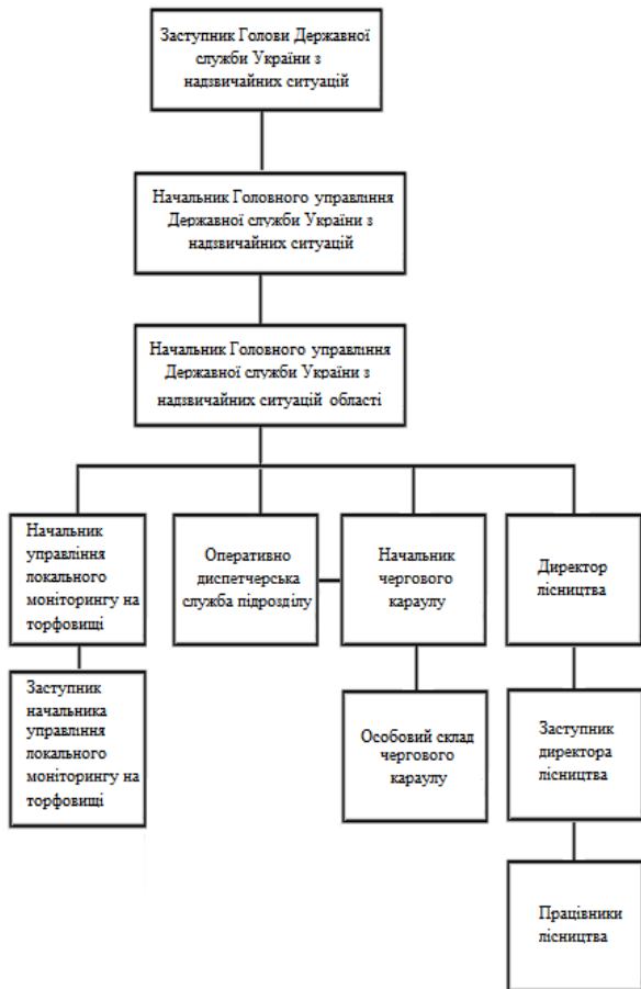
Рис. 1 – Структура керування системою локального моніторингу на торфовищі

Поєднавши структуру керування із складовими зовнішнього та внутрішнього середовища проекту, відображаємо проектне середовище для моделі проекту, яке включає ядро проекту, до складу якого входить моніторинг стану рівня безпеки, уникнення можливості підпалу, економія витрат для підрозділів Державної служби України з надзвичайних ситуацій на паливно-мастильні матеріали, розвиток наукових інновацій у галузі цивільного захисту, подальший розвиток підрозділів Державної служби України з надзвичайних ситуацій та реагування місцевих органів влади на поведінку торфовищ рис.2.