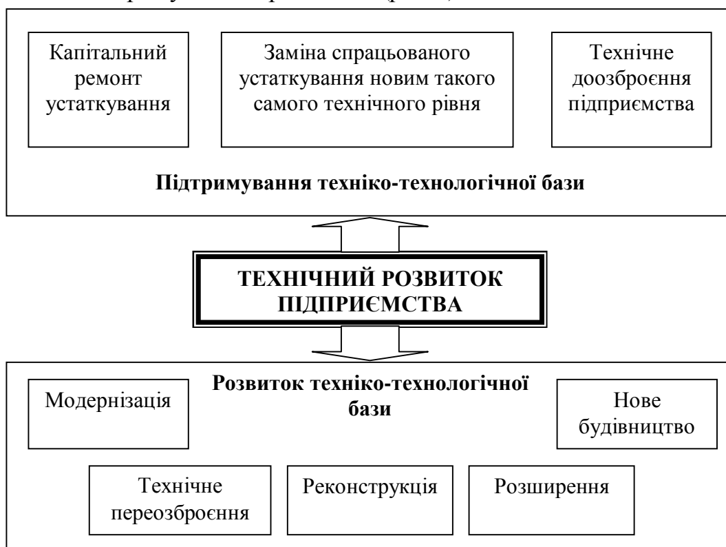
Рис. 2 – Форми технічного розвитку підприємства

Технічний розвиток як об'єкт організаційно-економічного управління охоплює різноманітні форми, які мають відображати відповідні стадії процесу розвитку виробничого потенціалу і забезпечувати просте та розширене відтворення основних фондів підприємства. Із сукупності форм технічного розвитку доцільно виокремлювати такі, що характеризують, з одного боку, підтримування техніко-технологічної бази підприємства, а з іншого — її безпосередній розвиток через удосконалення й нарощування виробництва (рис. 2).