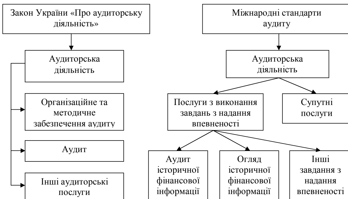
Рис. 1. Порівняння трактувань поняття аудиторської діяльності

Міжнародні стандарт аудиту (МСА), що розроблені автономним комітетом з міжнародних стандартів аудиту при Міжнародній федерації бухгалтерів, визначають аудиторську діяльність як послуги з виконання завдань з надання впевненості (аудит історичної фінансової інформації, огляд історичної фінансової інформації, інші завдання з надання впевненості) і супутні послуги [11]. В стандартах наводиться концептуальний підхід до тлумачення сутності аудиторських послуг, які надаються зовнішніми аудиторами та які потребують спеціального регулювання. Співставлення поняття «аудиторська діяльність» в обох документах можна надати схематично (рис. 1):