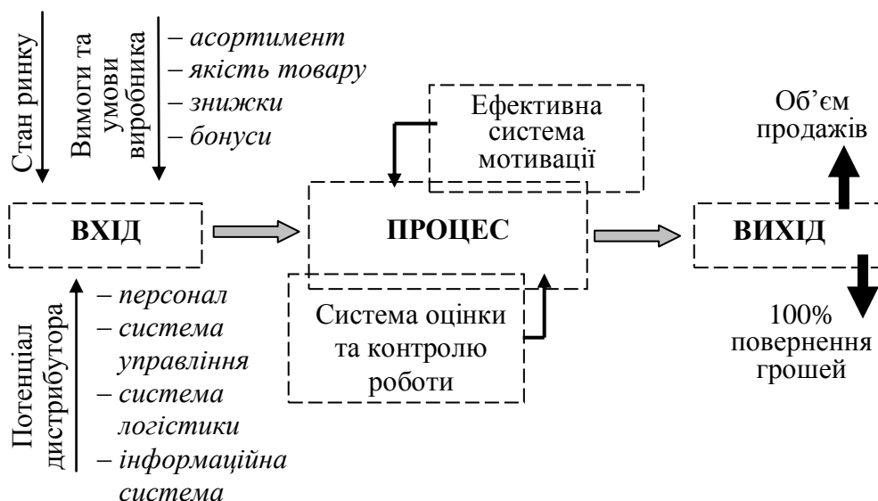
Рисунок 2. Визначення основних задач діяльності дистрибуторських компаній

Основні задачі, що підлягають виконанню дистрибуторськими компаніями є наступними (рис. 2):