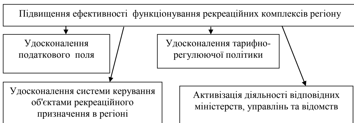
Рис.2 – Напрямки підвищення ефективності функціонування рекреаційних комплексів в регіоні

Активізація розвитку рекреаційних комплексів здійснюється с позиції співдружності з приватним бізнесом, з акцентом увагу на рекомендації керівництв таких комплексів, бо саме вони є джерелом інформації щодо стану, перспектив та особливостей розвитку рекреаційної галузі. В соціальному аспекті розвитку міста будується система комплексного надання послуг рекреації та супутніх галузей обслуговування. Населення забезпечується установами для змістовного проведення дозвілля. З економічної точки зору головним буде формування середовища для розвитку малого та середнього бізнесу та підприємництва в рамках регіону. В результаті впровадження стимулюючих заходів на рівні регіону прогнозуються наступні зміни: ріст цін на нерухомість у місцях розташування рекреаційних комплексів; ріст зайнятості населення регіону; розвиток сфер супутніх або близьких або обслуговуючих рекреаційні інтереси населення; розвиток інфраструктури регіону; притік інвестицій в регіон.