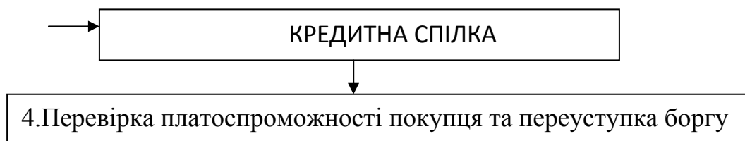
Рис. 1 - Схема здійснення кредитною спілкою факторингових операцій Фінансування при факторингу має ряд переваг, серед яких слід в першу чергу зазначити такі: