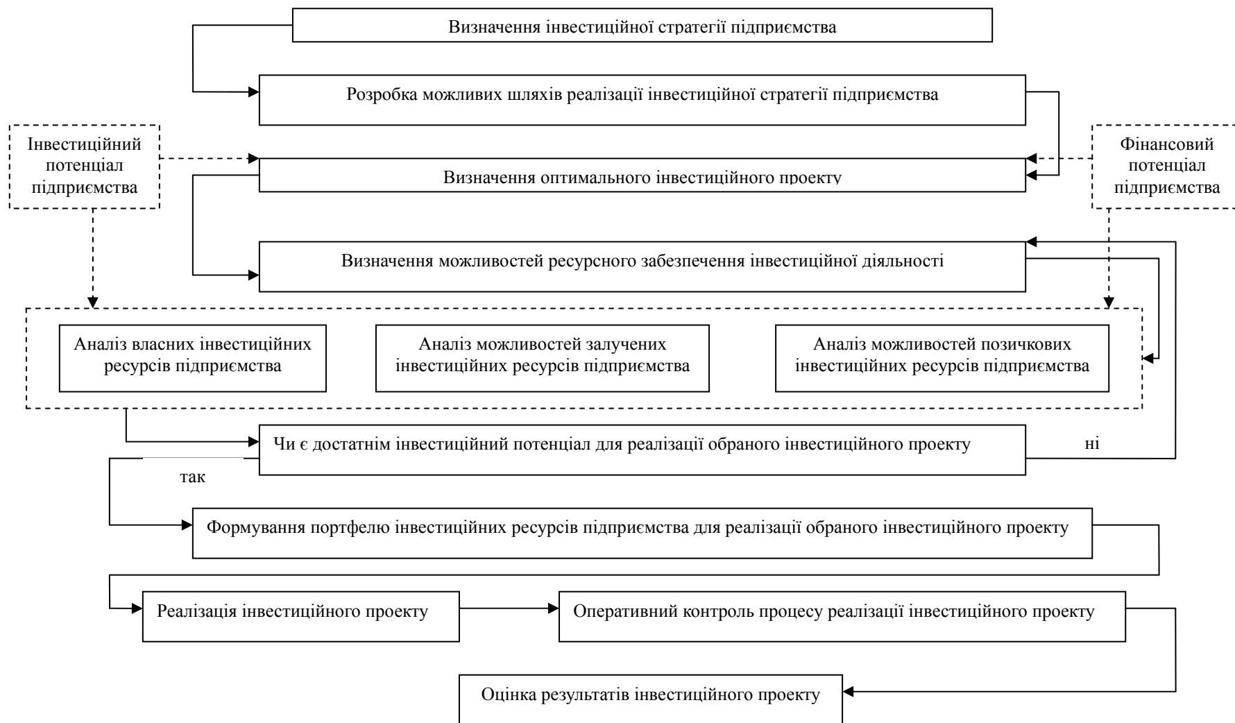
Рис. 2. Механізм здійснення інвестиційної діяльності з урахуванням інвестиційного потенціалу підприємства