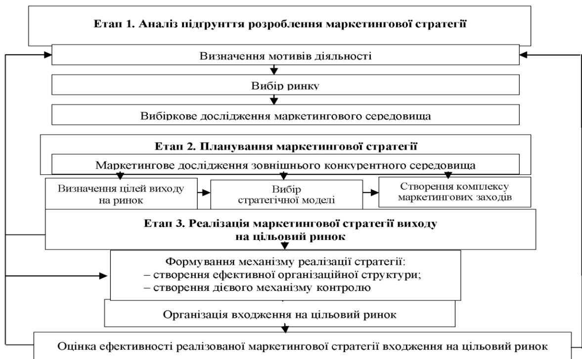
Рис. 1 - Схема процесу формування і реалізації маркетингових стратегій

Запропонована схематична модель досить чітко розділяє весь процес розробки та реалізації маркетингових стратегій, чітко відображає основні стадії її формування, детально визначає послідовні та паралельні етапи її реалізації та показує алгоритм взаємозв'язку між її маркетинговим інструментарієм.