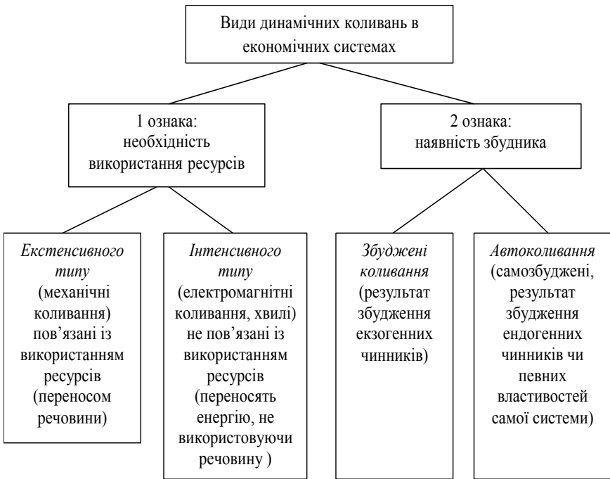
Рис. 1 - Види динамічних коливань в економічних системах