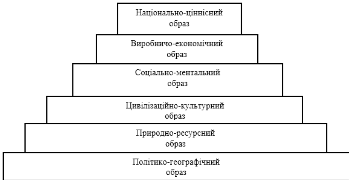
Рис. 1 – Іміджева модель управління іміджем країни

3. Брендінгова модель управління іміджем країни. Модель пропонує позиціонування країни таким чином, щоб вона могла здобути максимум користі та благ у міжнародній економічній системі, включаючи здобуття максимального світового визнання та впливу, укріпити свої партнерські відносини, оздоровити туристичну індустрію. С. Анхольт пропонує наступні фактори бренду країни: туризм, люди, культурна спадщина, експорт, управління, інвестиції та іміграція. За розробкою брендингової агенції Future Brand, бренд країни має будуватись навколо основних характеристик країни, які відображають найрізноманітніші її аспекти. Ці характеристики щорічно доповнюються і змінюються в наслідок того, що, розвиваючись, суспільство змінює свої пріоритети. На сьогоднішній день країни світу аналізуються за 30-ма факторами серед яких наступні: автентичність, історична спадщина, культура і мистецтво, курорти й інфраструктура, легкість подорожування, безпечність, відпочинок, краса природи, тощо [2]. В основу моделі положено твердження А. Чумікова, що імідж держави є визначальним для залучення іноземних інвестицій, розвитку туристичної сфери та встановлення двосторонніх стосунків. Схема моделі бренду країни представлена на рисунку 2 [5].