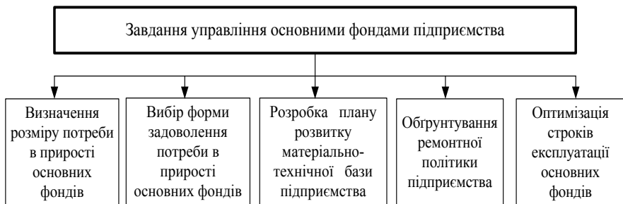
Рис. 1 - Завдання управління основними фондами підприємства

Метою і завданнями управління основними засобами підприємства є забезпечення максимально ефективного використання при мінімальних витратах на їх утримання та обслуговування (рис. 1).