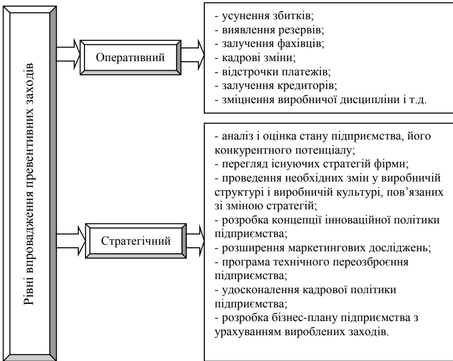
Рис. 2 – Рівні впровадження превентивних заходів запобігання банкрутства підприємства

З появою ознак наступу кризової ситуації виникає потреба спрогнозувати хід її розвитку (глибину і тривалість), виконати прогноз витрат і результатів, тобто виявити доцільність і спрямованість заходів для ліквідації явних загроз безпеці існування підприємства. При ухваленні рішення щодо виходу з даної ситуації є дуже важливим спрогнозувати можливість досягнення нової мети, виконання знову встановлених стандартів і виявити ті наслідки (економічного, політичного, екологічного характеру), що очікують підприємство після виходу його з кризи. Для досягнення цілей підприємства з виходу його з кризи необхідно приймати оперативні і стратегічні заходи (рис. 2).