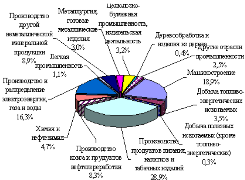
Рис. 2 - Отраслевая структура производства предприятий Харьковской области

По итогам 2014 года предприятия промышленности Харьковской