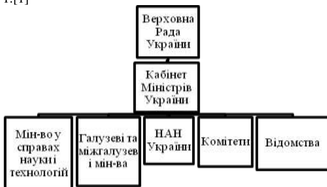
Рис.1 – Організаційна структура управління науковими дослідженнями в Україні

Аналіз стану питання. Управління науковою діяльністю в Україні будується за територіально-галузевим принципом. Схематично організаційну структуру управління науковими дослідженнями показано на рис. 1.[1]