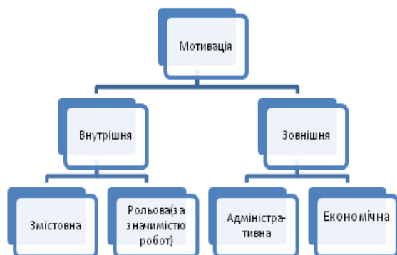
Рис. 2 – Види мотивацій

місяця і не використовує шаблонів для її виконання, але існують чітко підпорядковані єдиним поняттям системи та схеми (див. рис.2).