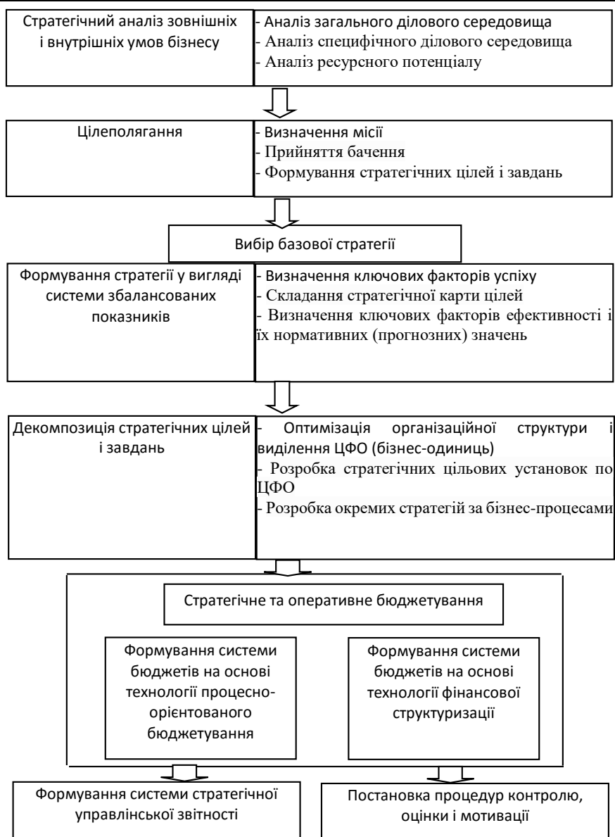
Рис. 2 - Взаємозв'язок елементів системи стратегічного управлінського обліку (розроблено автором)

У системі стратегічного управлінського обліку всі частини взаємопов'язані і взаємно доповнюють одна одну. Відсутність однієї частини є перешкодою для ефективного реалізації інших. У зв'язку з цим стратегічний управлінський облік являє собою інтегровану систему планування, обліку, контролю і аналізу.